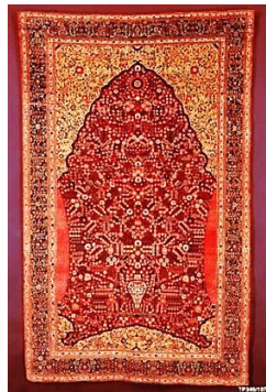
تصویر ۱۶. قالی با طرح محراب و هزارگل، بافت شمال هند، کشمیر، ابتدای نیمه دوم قرن ۱۸م، موزه متروپلیتن نیویورک

«سبک هزار گل نتیجه تأثیرات هنر اروپایی در قالی گلدار هندی از سال‌های ۱۶۲۰-۱۶۱۵م وارد طرح‌های مغولی شد. نقوش گیاهی به نسبت قبل کوچک‌تر شدند و زمینه به نقوش واگیره‌ای تکرارشونده تقسیم شد که در جهت معکوس در راستای طول و عرض قالی زمینه تکرار می‌شوند» (Walker, ۱۹۹۷: ۱۲۱).