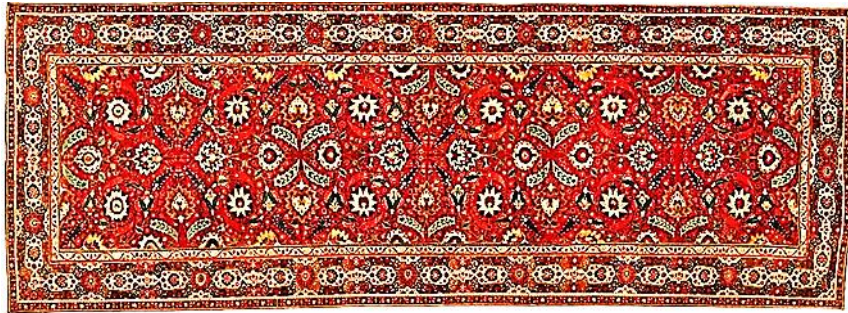
تصویر ۹. قالی با طرح پیچک‌های گلدان و گل لاهور در پاکستان امروزی، اواسط قرن ۱۷م بافت شمال هند، موزه متروپلیتن نیویورک (Walker, ۱۹۹۷: ۶۰)

این قالی در اواسط قرن ۱۷م در لاهور پاکستان با تارپود پنبه‌ای و پرز پشمی با گره نامتقارن در اندازه ۳۴۰/۴ \times ۹۲۲ سانتی‌متر بافته شده است (Walker, ۱۹۹۷: ۵۷). نقشه قالی در گروه طرح‌های تکراری واگیره‌ای قرار دارد که الگوی تکرار شونده (واگیره) در عرض دوبار به صورت قرینه آینه‌ای و در طول ۶ بار تکرار می‌شود.