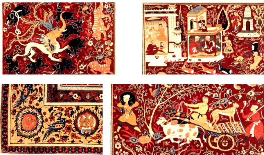
تصویر ۵. جزئیاتی از قالی تصویر ۴

زمان شاه‌جهان، حضور گسترده سبک جدیدی بود که ویژگی‌های گیاهان گلدار طبیعی را در زمینه یک سطح یا به صورت ردیفی از گل‌ها نشان می‌داد که انواع گل‌ها به صورت طبیعی در یک طرح مشبک به نمایش درآمده بودند. این سبک یک‌بار در هنر این دوران ظهور نکرد، بلکه در زمان اکبرشاه نیز از این سبک گلدار استفاده می‌شد؛ با این تفاوت که در دوره شاه‌جهان، نقوش کاملاً طبیعت‌گرایانه بودند و گیاهان گلدار در پس‌زمینه‌ای ساده نشان داده می‌شدند یا عموماً در ردیف‌هایی مرتب شده بودند. نحوه قرار گرفتن گل‌ها به صورت شبکه‌ای و قاب‌بندی شده بود. این سبک در دوره حکومت جهانگیر شاه وارد هنر کشور هند شد و در دوران شاه‌جهان به اوج محبوبیت رسید.