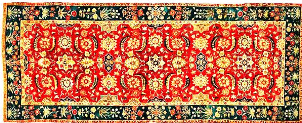
تصویر ۱۱. قالی با نقش پیچک گلدار و گل‌ها، بافت لاهور یا کشمیر، تاریخ ۱۶۵۰م، موزه متروپلیتن، نیویورک

این قالی با طرح هراتی قدیم و گل شاه‌عباسی در سال ۱۶۵۰م در شمال هند در کشمیر یا پاکستان در لاهور، با تاروپود ابریشمی و پرز از پشم ظریف بز هیمالیایی با گره نامتقارن فارسی در اندازه ۴۱۵/۹ × ۱۶۷/۶ سانتی‌متر بافته شده است.