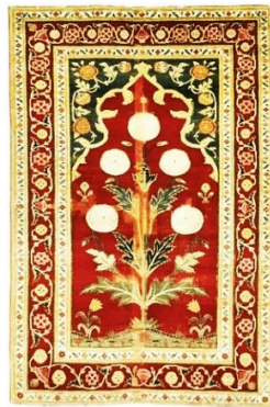
تصویر ۱۵. قالی با طرح محراب و تک‌گل، بافت شمال هند لاهور یا کشمیر، اواسط قرن ۱۷م، موزه متروپلیتن نیویورک

قالی (تصویر ۱۵) در اواسط قرن ۱۷م در هند یا پاکستان، در لاهور یا کشمیر با تاروپود پنبه‌ای و پود ابریشمی، پرز پشمی و گره نامتقارن در اندازه ۱۰۲/۸ \times ۱۵۴/۹ سانتی‌متر بافته شده است. به این دسته از قالی‌ها که شامل نقش یک گیاه بزرگ در زمینه و محراب در بالای قالی می‌شود، عنوان جانمازی اطلاق می‌شود (walker, 1997:90). بر روی زمینه قهوه‌ای (روشن)، رنگ این قالی یک تک‌گل بزرگ خشخاش با ۵ شکوفه در اطراف آن و ساقه‌ای پربرگ که دو طرف آن را دو گل لاله کوچک با گلبرگ‌های قرمز و سفید احاطه کرده، به سبک هنر هندی مغولی قرن ۱۷م طراحی شده است.