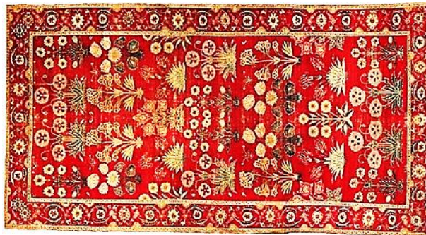
تصویر ۱۳. قالی با طرح ردیف گیاهان گلدار، بافت شمال هند لاهور یا کشمیر، تاریخ ۱۶۵۰م، موزه متروپلیتن نیویورک (walker, ۱۹۹۷: ۹۶)

این نمونه با تاروپود پنبه‌ای و پرز پشمی، تراکم گره ۱۵۰ گره در هر اینچ مربع و گره نامتقارن به اندازه ۲۰۷/۶ \times ۴۳۱/۸ سانتی‌متر به تاریخ ۱۶۵۰م در هند یا پاکستان امروزی لاهور یا کشمیر بافته شده است (Walker, ۱۹۹۷: ۹۵).