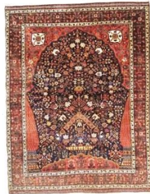
تصویر ۱۷. قالی ناظم قشقایی (ژوله، ۱۳۸۱: ۲۰۶)

سبک قالی (تصویر ۱۶) «از دوران صفوی در همه شهرهای ایران و نیز هندوستان به شیوه‌های مختلف بافته می‌شده است و در میان ایل قشقایی توسط بافندگان طایفه کشکولی به طرح «ناظم» مشهور است» (وکیلی، ۱۳۸۲: ۱۳۲) (تصویر ۱۷). در طراحی نقوش اثری از ناتورالیستی و طبیعت‌گرایی دیده نمی‌شود و خوشه‌های گل طرحی شماتیک دارند. حاشیه اصلی با نقش «خوشه انگوری» یا «سنبل و ده گل» بر روی زمینه قهوه‌ای سوخته، یکی از عناصر نقش‌پردازی قالی ناظم را تشکیل می‌دهد که در نمونه تصویر ۱۶ نیز دیده می‌شود که خود سندی دال بر تأثیر هنر هندی از هنر ایرانی است.