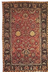
تصویر ۱. قالی ایرانی سبک هراتی زمینه گل‌دار، اصفهان، قرن ۱۰هـ/ ۱۶م (یاوری و همکاران، ۱۳۹۳: ۲۹۰)

همان‌طور که در تصویر ۱ در این قالی هراتی می‌بینیم، فضای متن، ترکیبی از گل‌های درشت در کنار گل‌های کوچک و ظریف و استفاده از نقش اسلیمی ماری در کنار گل‌هاست، با گل‌های شاه‌عباسی پنج‌پر بزرگ در پایین قالی که درون هر یک، گل‌های ریز گرد و تزئیناتی دیگر قرار دارد. تمام بندهای ختایی و شاخه و برگ‌ها از این گل بزرگ سرچشمه می‌گیرند. حاشیه بزرگ این قالی به سبک هراتی، ردیفی از گل‌های شاه‌عباسی درشت است که با بندهایی ظریف از ختایی‌ها به یکدیگر متصل شده‌اند و جهت هر دو گل به سمت مخالف، یکی به سمت داخل و دیگری خارج متن قرار دارد.