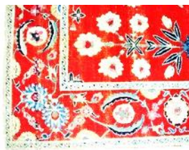
تصویر ۱۴. قسمتی از حاشیه تصویر ۱۳ ( https://www.metmuseum.org/art/collection/search/۴۵۲۱۹۷ )