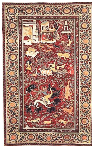
تصویر ۴. قالی با طرح تصویری، لاهور، ۱۵۹۰-۱۶۰۰ میلادی