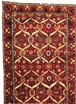
تصویر ۶. قالی سبک هند، اواسط قرن ۱۷م زمان شاه‌جهان (زوله، ۱۳۸۱: ۲۱۶)

استفاده از سبک طبیعی گل‌ها با نمونه گیاهانی که بر روی زمینه لاک‌ی چیده می‌شدند، احتمالاً از زمان حکومت شاه‌جهان به بعد تاریخ‌گذاری می‌شوند. تغییر این طرح به صورت قاب‌بندی و چارچوب‌بندی نقش گیاهان به شکل شبکه‌ای طلایی بود که احتمالاً در زمان اورنگ‌زیب گسترش پیدا کرد؛ چراکه این شبکه نقش‌مایه‌ای اختصاصی در تزئینات معماری دوران حکومت او بود. کاربرد این نقش تا سده ۱۲هـ/۱۸م ادامه پیدا کرد (برند، ۱۳۸۳: ۲۲۵). نمونه‌قالی با این سبک از طراحی، شامل شبکه‌ای از گل‌ها و برگ‌ها به صورت قاب‌بندی در زمینه لاک‌ی در تصویر ۶ آورده شده است.