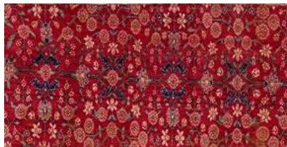
تصویر ۱۹. جزئیاتی از متن شامل برگ نخل و گل کاغذی (نگارنده)

طرح زمینه، متشکل از جفت برگ‌های نخل و گل کاغذی با برگ‌هایی لبه‌دار به رنگ آبی تیره است که به‌طور متناوب باز و پیچ‌خورده هستند (تصویر ۱۹).