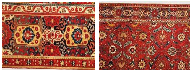
الف. حاشیه با نقش کتیبه به سبک هراتی ب. متن قالی در کنار حاشیه

تصویر ۱۰. جزئیاتی از تصویر ۹ ( https://www.metmuseum.org/art/collection/search/446998 )