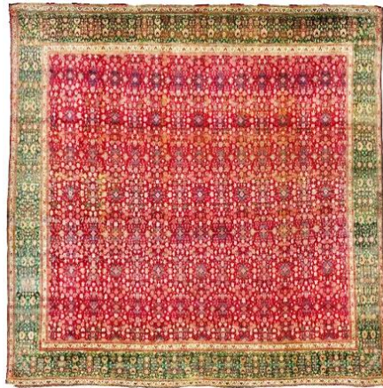
تصویر ۱۸. قالی هزارگل، بافت کشمیر، اواسط یا اواخر قرن ۱۷م ( https://www.metmuseum.org/art/collection/search/۴۶۱۵۲۷ )

طرح زمینه، متشکل از جفت برگ‌های نخل و گل کاغذی با برگ‌هایی لبه‌دار به رنگ آبی تیره است که به‌طور متناوب باز و پیچ‌خورده هستند (تصویر ۱۹).