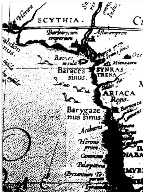
تصویر ۴- نقشه تاریخی اورتلوس از اقیانوس هند، با مارهای دریایی در کنار آن (Seland, 2022: 29)

۵- عباسی (اسلام متأخر) ۷۵۱-۱۰۱۱ م. اواخر قرن هشتم تا یازدهم میلادی و بعدها تا حدود قرن دوازدهم (Khan, 1969: 49-55).