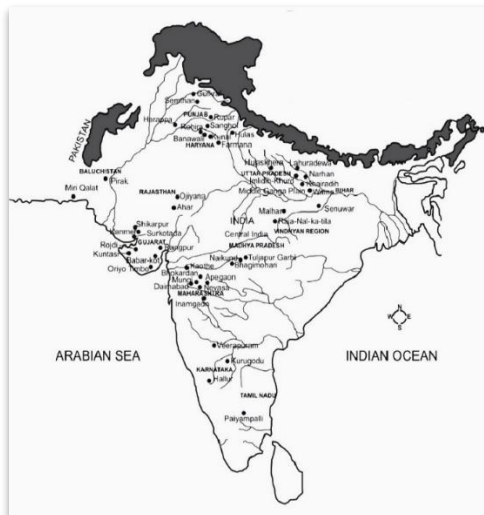
تصویر ۱- نقشه شبه‌قاره هند در دوران باستان (Kajale, 2003)