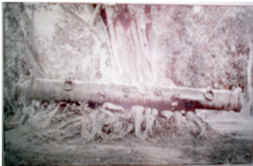
عکس از کتاب مسند مرشدآباد (۱۹۰۴-۱۷۰۴)