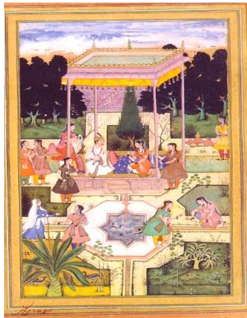
تصویر ۱. وجود عناصر نقاشی ایرانی در صفحه ۷۵ مرقع گلشن، مصورسازی در زمان پادشاهی اکبرشاه

هنرمندان پس از دو سال زندگی در قندهار به فرمان همایون‌شاه که فارغ از جنگ شدند و مجال آزاد داشتند، به هند دعوت شدند. پس از ورود آنان، همایون‌شاه ساختمان قلعه قدیمی در دهلی که در سه طبقه بود و امروزه در (پورناکیلا) دهلی هنوز هم استفاده می‌شود، را برای آنان مهیا ساخت (راجرز، ۱۳۸۲: ۵۱) و ریاست آن را به میرسیدعلی داده است (آژند، ۱۳۸۹: ۵۵۱). عبدالصمد نیز رئیس ضربخانه هند شد (راجرز، ۱۳۸۲: ۵۲). در توزک‌نامه جهانگیری به مشق تصویر شاهزاده اکبر در کابل زیر نظر عبدالصمد اشاره شد (جهانگیرگورکانی، ۱۳۵۹: ۱۸-۱۹). میرسیدعلی و عبدالصمد در سال ۹۶۲ ه.ق/ ۱۵۵۴ م در جوار همایون به هنگام تسخیر هند، وارد دهلی شدند. در این هنگام همایون‌شاه در محوطه قلعه کهنه دهلی کتابخانه‌ای ایجاد کرد (غروی، ۱۳۸۵: ۳۸) و اسباب آسایش آنان را مهیا ساخت. همایون‌شاه اسباب و لوازم نگارگری را برای آن‌ها فراهم کرد و برای تشویق آنان شاه اغلب از این کتابخانه بازدید می‌کرد (کریم‌زاده تبریزی، ۱۳۶۳: ۳۳۰). این مکان آغازی برای سبک هندی-ایرانی بود. در زمینه تیره و شلوغ نگاره‌های هندی، ترکیب‌بندی و فیگورهای ایرانی خودنمایی می‌کنند؛ مانند: نقش کلاه فرنگی با حیاط مفروش و میله‌هایی به رنگ قرمز در حکم نرده و حوضی که غالباً در میان آن دیده می‌شود (تصویر ۱).