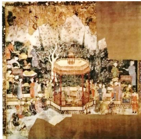
تصویر ۲. شاهزادگان سرای تیموری، نقاشی روی پارچه کتان، ابعاد ۱۲۵ × ۱۲۵ سانتی‌متر

رنگ‌های متضاد در این نگاره با چشم‌اندازهای متغیر کوچک به‌طوری احساس می‌شوند که در حال محوشدن هستند. حاشیه این نگاره دارای تذهیب است. شخصیت‌های کشیده‌شده و استفاده از رنگ آبی و قرمز در رنگ آمیزی لباس آن‌ها با هم مساوی بوده و دارای تعادل است. در مرکز تصویر بانویی دیده می‌شود که به احتمال باید همسر همایون‌شاه باشد. نقاشی مذکور با چهار سرو آراسته شده و در مرکز تصویر چهار شخصیت جلوس کرده‌اند و در مجموع چهل شخصیت در نگاره قابل‌رؤیت است که این خود نشان از نظم نگارگر در ترسیم آن است. این نگاره که از نظر تاریخی بسیار مهم تلقی می‌شود، سرآغاز نقاشی هندی-ایرانی نیز به شمار می‌رود (تصویر ۲).