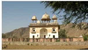
شکل ۲. نمای کلی و برخی از آرایه‌های عمارت ویرات‌نگر/ بایرات، راجستان، سده یازدهم ه.ق. (مأخذ: وبسایت شماره ۲؛ الف) نمای شرقی عمارت (ب) نمای صفا ورودی (ج) آرایه‌های گنبدخانه (د) آرایه یکی از فضاهای داخلی (مأخذ: وبسایت ۱).

معماری دوران اسلامی در اواخر سده‌های میانه و متأخر، به تجربه‌های جدیدی دست یافت که یکی از مهم‌ترین‌شان آب‌پردازی در حوزه معماری منظر بود. گزارش‌های جغرافیانگاران، قراین تاریخی و شواهد معماری نشان می‌دهند که این تجربه برگرفته از معماری منظر هندو است. نخستین سلاطین مسلمان شبه‌قاره که از سرزمینی با اقلیم سرد و خنک برخاسته بودند، به ساخت این تال‌ها/ آبگیرها مبادرت ورزیدند تا ضمن تعدیل هوا در اقلیم حاره‌ای شبه‌قاره، منبع آب بزرگی را برای تأمین نیاز ساکنان شهرها فراهم کنند. قراین تاریخی نشان می‌دهند که غیر از کارکردهایی که از آن گذشتیم، تال‌ها به‌منظورهای دیگری