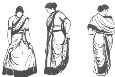
(تصویر ۴- 4 Biswas, 2017)