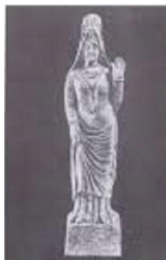
تصویر ۸- مجسمه زن پارت