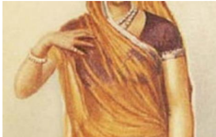
تصویر ۱۷- پیراهن زن راجستانی

در گیلان، زنان پیراهنی کوتاه و آستین‌بلند بر تن می‌کنند. با توجه به شواهد تاریخی این پیراهن در طی قرن‌های متمادی تغییر چندانی نکرده است. بخش‌های پیش سینه و مچ دست‌ها معمولاً با پراک‌های رنگی و طلایی تزئین می‌شوند (تصویر ۱۶). در راجستان زنان پیراهن یا بلوزی کوتاه تا کمر یا بالاتر از آن با آستین‌های کوتاه معمولاً تا آرنج یا کوتاه‌تر به تن می‌کنند، این پیراهن بدون یقه بوده و از پشت گاهی تا کمر لخت است (تصویر ۱۷) می‌توان گفت شرایط آب‌وهوایی و همچنین مذهب باعث تغییراتی در بلندی پیراهن و آستین آن در گیلان شده است.