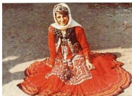
تصویر ۱۳- لباس محلی زنان املش (رهنمایی، ۱۳۹۳)