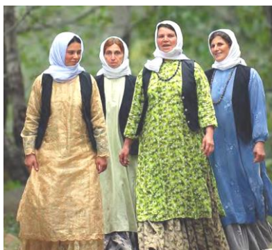
تصویر ۱۱- لباس محلی زنان تالش (رهنمایی، ۱۳۹۳)

لباس‌های محلی زنان گیلان را می‌توان به سه بخش شرق، غرب و مرکز تقسیم‌بندی کرد. لباس‌های زنان شرق گیلان به لباس «قاسم‌آبادی» (تصویر ۱۰)، لباس زنان غرب گیلان «تالشی» (تصویر ۱۱) و لباس مرکز گیلان با عنوان «رسوخی» معروف است. لباس رسوخی بیشتر در شهر ماسوله دیده می‌شود که یادگار زمان قاجار است و از شهرهایی مانند زنجان به گیلان رسوخ کرده است. پارچه‌هایی که در لباس زنان شرق و غرب گیلان به کار می‌رود، متفاوت است. در لباس زنان غرب گیلان متن پارچه‌های لباس دارای گل‌های رنگارنگ و درشت است، درحالی‌که در لباس زنان شرق گیلان زمینه پارچه ساده و یک‌رنگ است و تزئینات آن از نواردوزی‌هایی با رنگ‌های مختلف تشکیل شده است (همان: ۸). از شهرهای دیگر گیلان می‌توان به رودسر (تصویر ۱۲)، املش (تصویر ۱۳) و همچنین رودبار، رشت، بندر انزلی و صومع‌سرا اشاره کرد. هرچه به کوهپایه‌های گیلان نزدیک‌تر شویم، نوع پارچه برای دوخت لباس زنان ضخیم‌تر می‌شود، مثلاً آن‌هایی که در دیلمان زندگی می‌کنند، بیشتر از پارچه مخمل استفاده می‌کنند و آن‌هایی که در جلگه زندگی می‌کنند، لباس‌هایشان ابریشمی است؛ اما به‌طور کلی روسری و سربند (لچک)، پیراهن یا جمه، جلیقه، الجاقبا، کت، دامن، شلیته، شلوار و چادر کمر از بخش‌های اصلی لباس محلی زنان گیلان است (گیلان/ www.hamshahrionline.ir ).