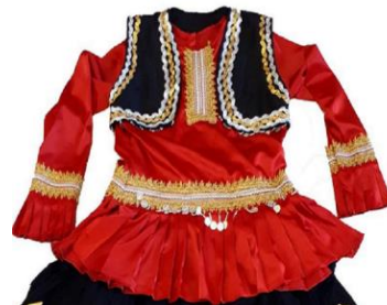
تصویر ۱۶- پیراهن زن قاسم‌آبادی