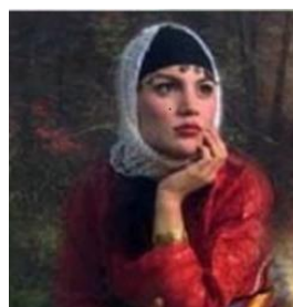
تصویر ۱۴- پوشش سر زن گیلانی