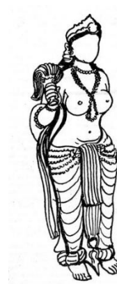
(تصویر ۱- 1 Biswas, 2017)