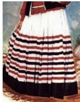
تصویر ۱۸- دامن زن قاسم‌آبادی