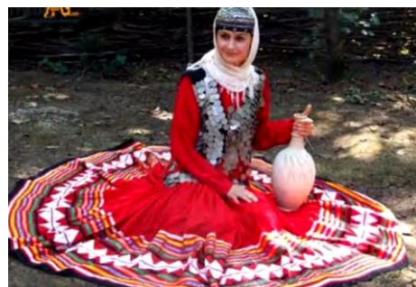
تصویر ۱۰- لباس محلی زنان قاسم‌آباد (رهنمایی، ۱۳۹۳)