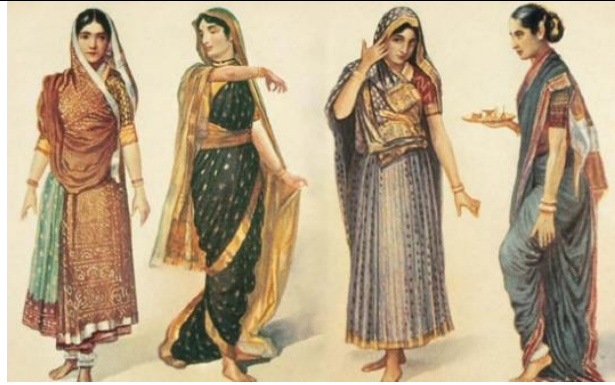
تصویر ۵- www.Satyam-shivam-sundaram.org/ Indian clothes

«مردمان پنجاب نیز ترکیبی از لهینگا و چولی می‌پوشند. لهینگا که دامن بلندی است، معمولاً با تزئینات و نواردوزی در پایین آن دوخته می‌شود.» (Alkazi, 1983: 109). جنس لهینگا برای استفاده روزانه از پارچه‌های پنبه‌ای است و در مراسم و جشن‌ها و عروسی‌ها به تزئینات آن با آینه‌کاری و دوخت‌های تزئینی افزوده می‌شود (Biswas, 2017: 135). شلوار نیز از پوشش‌های دیگری است که در بین دختران مرسوم است و به نام‌های سیندی سوتان (sindhi suthan)، دوگری پیجاما (dogri pajama) و کشمیری سوتان (Kashmiri suthan) در مناطق مختلف کاربرد دارد (Tarlo, 1996: 95).