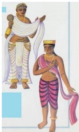
(تصویر ۳- 3 Hatt, 2000)

می‌شود. «سلاطین مسلمان نظیر اکبرشاه، قوانین جدیدی برای پوشش اعمال می‌کنند که باعث تغییرات مشهودی در لباس زنان هندی از جمله پوشاندن بدن به‌طور کامل به‌جز صورت و دست‌ها می‌شود (همان: ۳۵-۳۷).