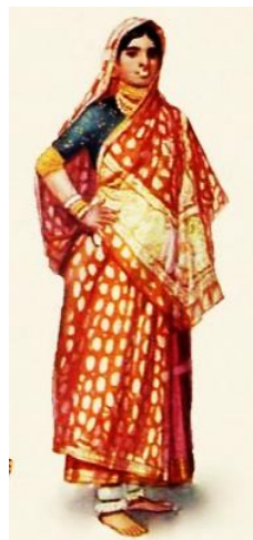
تصویر ۶- www.Satyam-shivam-sundaram.org / Indian clothes

راجستان - راجستان بزرگ‌ترین ایالت هندوستان است که به‌عنوان سرزمین پادشاهان شناخته شده و در گذشته راجپوتانا خوانده می‌شد. ایالت راجستان در شمال غربی هند واقع شده و در غرب آن پاکستان، در جنوب غربی آن گجرات، در جنوب شرقی آن مادیا پرادش، در شمال شرقی آن اوتار پرادش و هاریانا و در شمال آن پنجاب قرار دارد. مساحت راجستان ۳۴۲'۲۳۹ کیلومتر مربع و مرکز آن شهر جاییور است. راجستان از ۲۵۰۰ سال پیش از میلاد و پیش از آن مسکونی بوده‌است. قبایل بهیل و مینا را نخستین ساکنان این منطقه می‌دانند. آریائیان در حدود ۱۴۰۰ سال پیش از میلاد به راجستان آمدند و با پس‌راندن بومیان پیشین به سوی جنوب، برای همیشه در راجستان نشیمن گزیدند ( indiavivid.org/Rajasthan-clothing-styles ). - پوشاک زنان راجستان از سه بخش عمده تشکیل می‌شود: چولی (choli) بلوز یا پیراهنی معمولاً آستین کوتاه و بدون یقه و پشت آن گاهی تا کمر باز است. گاگرا (Ghaghara) که دامن بلندی است و تزئینات و نواردوزی‌های رنگی و برودری دوزی در پایین آن دوخته می‌شود. اودانی (Odhani) روسری یا شال بلندی است که روی سر قرار می‌گیرد (تصویر ۶).