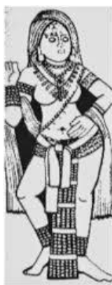
(تصویر ۲- 2 Biswas, 2017)