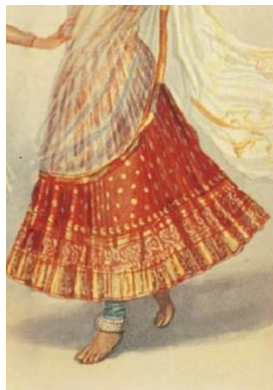
تصویر ۱۹- دامن زن راجستانی

همانطور که در تصاویر به‌دست‌آمده از لباس در گیلان مشهود است، زنان دامنی بلند و پرچین به تن می‌کرده‌اند که همچنان به همان شکل مورد استفاده قرار می‌گیرد. در پایین دامن به‌طور منظم و زیبایی نوارها و روبان‌های رنگی دوخته می‌شود (تصویر ۱۸). زنان راجستان نیز دامنی همانند زنان گیلانی به تن می‌کنند. قد دامن تا قوزک پا بلندی دارد. تزئینات روی دامن نیز مانند دامنی است که زنان گیلانی در مناطق قاسم‌آباد، املش و رودسر استفاده می‌کنند (تصویر ۱۹).