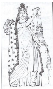
تصویر ۹- آناهیتا،

با توجه به تاریخ ایران باستان، مادها اولین قوم ایرانی بوده‌اند که می‌توان نوع و نحوه پوشش آن‌ها را از طریق کاوش‌های باستانی به دست آورد. «پیراهن مادی یک پوشش بلند است که تا زانو می‌رسد. پوشاک زنان آن دوره، از لحاظ شکل (با کمی تفاوت) با پوشاک مردان یکسان است و در زمانی دراز، پوشاک زنان با کندی به تدریج تنوع گرفته است (تصویر ۷). یکی از نقوش بانوان منتسب به پارسی‌ها، زنی را نشان می‌دهد که پیراهنی بلند با آستین کوتاه پوشیده است و پایین دامنش ریشه دارد.» (ضیاءپور، ۱۳۴۷: ۵۱). در دوره هخامنشی، نوع پوشاک زنان شباهت زیادی با دوره مادها دارد، اما در دوره اشکانی این نوع پوشش متفاوت می‌شود (تصویر ۸). «پوشاک بانوان در آن دوره، پیراهن بلند است که تا روی زمین می‌رسیده و نیز فراخ و آستین‌دار و یقه‌راست بوده است، پیراهنی دیگر داشته‌اند که روی اولی می‌پوشیدند. قد این یک، نسبت به اولی کوتاه و ضمناً یقه‌باز بوده است و روی این دو پیراهن، چادری بر سر می‌کردند.» (ضیاءپور، ۱۳۴۷: ۸۴-۸۱). «لباس زنان در دوره ساسانیان را عموماً پیراهن یک‌دست و بلند و پرچین تشکیل می‌داده که گاهی آن را با نواری در زیر سینه یا کمی پایین‌تر جمع می‌کردند و می‌بستند، گاهی نیز قسمت انتهای دامن را به وسیله پارچه‌ای اضافی و پرچین‌تر می‌دوختند. هر دو نوع پیراهن‌ها، آستین‌هایی بلند تا مچ دست‌ها و یقه‌ای گرد و ساده و نسبتاً بسته داشته‌اند.» (تصویر ۹) (چیت‌ساز، ۱۳۷۹: ۱۴).