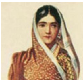
تصویر ۱۵- پوشش سر زن راجستانی

پوشش سر زنان گیلان در مقایسه با زنان راجستان، شامل کلاه کوچکی است که در زیر روسری بلند و سفید بر سر گذاشته می‌شود. این کلاه با انواع پولک و دوخت‌ها تزئین می‌شود (تصویر ۱۴). در صورتی که زنان راجستان در زیر روسری بلند خود کلاهی بر سر نمی‌گذارند (تصویر ۱۵). به احتمال زیاد یکی از عوامل برسرنگذاشتن کلاه در این منطقه، شرایط آب‌وهوایی گرم و شرجی‌تر نسبت به گیلان است؛ البته در مناطقی مانند تالش، زنان کلاه بر سر نمی‌گذارند.