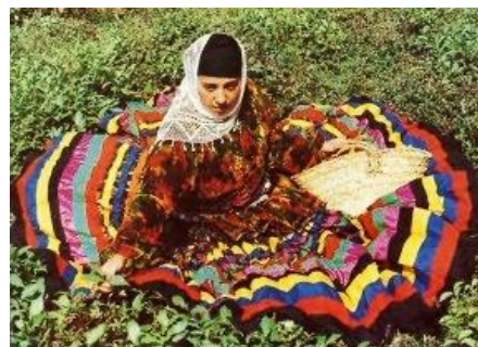
تصویر ۱۲- لباس محلی زنان رودسر (رهنمایی، ۱۳۹۳)