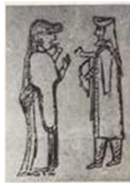
تصویر ۷- زن ماد نقش روی جعبه