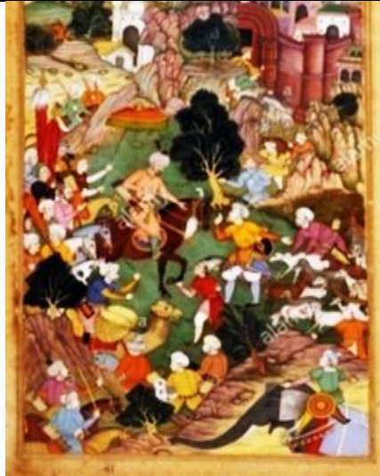
تصویر ۲- بابر در خانجا در نزدیکی کابل، موزه ملی هند، دهلی

https://www.alamy.com/stock-photo-babur-at-the-spring-of-khanja-sili-yaram-kabul-from-babur-nama-fol-20829075