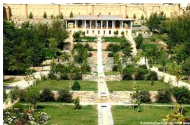
تصویر ۷- باغ هشت‌بهشت در کابل

طرح چهارباغ مجموعه باغ‌های بابر درحقیقت براساس طرح چهارباغ بهشت است که در قرآن مفهوم چهارباغ ذکر شده است: «و برای کسی که از مقام پروردگارش بترسد، دو باغ بهشتی است، پس کدام یک از نعمت‌های پروردگارتان را انکار می‌کنید» (سوره الرحمن، آیه ۴۶). «و در کنار آن دو بهشت، دو بهشت دیگر است، پس کدام یک از نعمت‌های پروردگارتان را انکار می‌کنید» (سوره الرحمن، آیه ۶۲). وسط باغ مزین به استخر بزرگ و چهارگوش است که به طرف چهار گوشه باغ آبراه دارد و در زمین مربع شکل مابین آبراه‌ها، درختان برای سرسبزی و زیبایی و اعتدال هوا کاشته شده‌اند (Cornell, 2007: 94). نام باغ‌هایی که بابر در هند ساخت، نشان می‌دهد که کابلی باغ، چهارباغ، باغ نیلوفر، باغ زرافشان، هشت بهشت و باغ وفا، متأثر از معماری ایران است، با خیابان‌ها و طرح‌ریزی‌هایی که توسط بابر به هند انتقال یافته بود. باغ وفا اولین باغ ساخته شده توسط بابر بود و در آن نهری جریان داشت و درختان پرتقال، لیمو و انار در آن کاشته شده بود. بابر میوه‌های هندی را به کابل نیز انتقال داد و نیشکر از هند به باغ وفا در آدینه‌پور (جلال‌آباد امروز و مرکز ایالت ننگرهار) آورد. بابر ذوقی را که در عمران و آبادسازی داشت در مدت کوتاه زندگی خود در هند به کار برد، باین‌حال چون پیش از بابر هنر بازسازی و تعمیر بنا در هند، سوابق درخشانی داشت و هم بابر در سمرقند و هرات نمونه‌هایی ارزنده از معماری را دیده بود یا تقلید می‌کرد، دوره بابر را در هند، دوام همان سبک معماری دوره‌های خلجیان و لودیان افغانی گفته‌اند که نمایندگی سبک مخلوط اسلامی و هندی را بیان می‌کند (حبیبی، ۱۳۵۱: ۱۱۶).