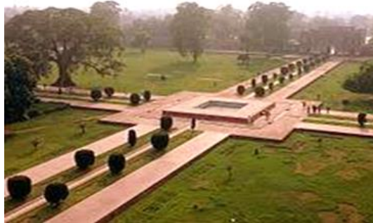
تصویر ۵- چهارباغ https://en.wikipedia.org/wiki/Charbagh

در هند، باغ‌های ایرانی در بستری از فرهنگ و اقلیم با تغییر رویکرد زندگی از سبک چادرنشینی به استقرار دائم شکل گرفت. تمایل ذاتی سلاطین مغول برای زندگی کوچ‌نشینی در طبیعت و نیز روحیات آنان به‌عنوان یک سرباز جنگجو باعث می‌شد زندگی در چهارباغ را به گذراندن اوقات در یک قصر محدود و سر بسته ترجیح دهند. بابر در کابل به دلیل فصل سرد و سخت زمستان اجباراً در قصر اقامت می‌گزید و سپس با آمدن بهار، به تبعیت از سبک زندگی آسیای میانه، در اردوهای خود و چراگاه‌ها و باغ‌های اطراف شهر روزگار می‌گذراند (موسوی‌حاجی و همکاران، ۱۳۹۳: ۱۶۱). بابر به معماری و ساخت بناهای زیبا نیز علاقه‌مند بود و هنگامی که در کابل بود، دستور ساخت چهارباغی را به سبک چهارباغ هرات صادر کرد. این چهارباغ به وسیله چهار خیابان از هم جدا می‌شدند و هر باغ با نهرهای پرآب به باغچه‌های کوچک‌تر تقسیم می‌شد. در کنار چهارباغ، معمولاً بازارچه و مدرسه ساخته می‌شد و مکانی برای اطراق و سفرهای چندروزه پادشاهان و حاکمان محلی در نظر گرفته شده بود که همگی تقلیدی از معماری ایران بود و این سبک معماری چهارباغ در هند بیشتر از ایران به کار رفته است. همچنین بناهای دیگری چون حمام نیز در آنجا ساخته می‌شد. علامی در اکبرنامه از چهارباغ‌های کابل و قندهار سخن گفته است. در بیشتر آرامگاه‌های شاهان مغولی هند از طرح چهارباغ نیز استفاده شده است (علامی، ۱۳۷۲: ۳۴۳ و ۳۵۱).