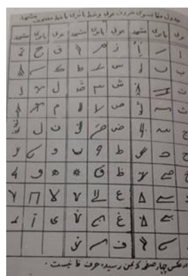
تصویر ۴- نمونه خط بابر شاه، ظهیرالدین محمد بابر، (مأخذ: حبیبی، ۱۳۵۱: ۷۶-۷۷)