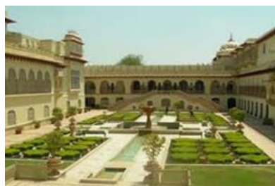
تصویر ۸- رام‌باغ در آگرا

https://en.wikipedia.org/wiki/Hasht_Behesht