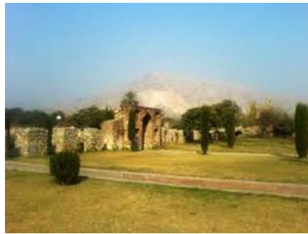
تصویر ۶- باغ وفا در آدینه‌پور کابل

طرح چهارباغ مجموعه باغ‌های بابر درحقیقت براساس طرح چهارباغ بهشت است که در قرآن مفهوم چهارباغ ذکر شده است: «و برای کسی که از مقام پروردگارش بترسد، دو باغ بهشتی است، پس کدام یک از نعمت‌های پروردگارتان را انکار می‌کنید» (سوره الرحمن، آیه ۴۶). «و در کنار آن دو بهشت، دو بهشت دیگر است، پس کدام یک از نعمت‌های پروردگارتان را انکار می‌کنید» (سوره الرحمن، آیه ۶۲). وسط باغ مزین به استخر بزرگ و چهارگوش است که به طرف چهار گوشه باغ آبراه دارد و در زمین مربع شکل مابین آبراه‌ها، درختان برای سرسبزی و زیبایی و اعتدال هوا کاشته شده‌اند (Cornell, 2007: 94). نام باغ‌هایی که بابر در هند ساخت، نشان می‌دهد که کابلی باغ، چهارباغ، باغ نیلوفر، باغ زرافشان، هشت بهشت و باغ وفا، متأثر از معماری ایران است، با خیابان‌ها و طرح‌ریزی‌هایی که توسط بابر به هند انتقال یافته بود. باغ وفا اولین باغ ساخته شده توسط بابر بود و در آن نهری جریان داشت و درختان پرتقال، لیمو و انار در آن کاشته شده بود. بابر میوه‌های هندی را به کابل نیز انتقال داد و نیشکر از هند به باغ وفا در آدینه‌پور (جلال‌آباد امروز و مرکز ایالت ننگرهار) آورد. بابر ذوقی را که در عمران و آبادسازی داشت در مدت کوتاه زندگی خود در هند به کار برد، باین‌حال چون پیش از بابر هنر بازسازی و تعمیر بنا در هند، سوابق درخشانی داشت و هم بابر در سمرقند و هرات نمونه‌هایی ارزنده از معماری را دیده بود یا تقلید می‌کرد، دوره بابر را در هند، دوام همان سبک معماری دوره‌های خلجیان و لودیان افغانی گفته‌اند که نمایندگی سبک مخلوط اسلامی و هندی را بیان می‌کند (حبیبی، ۱۳۵۱: ۱۱۶).