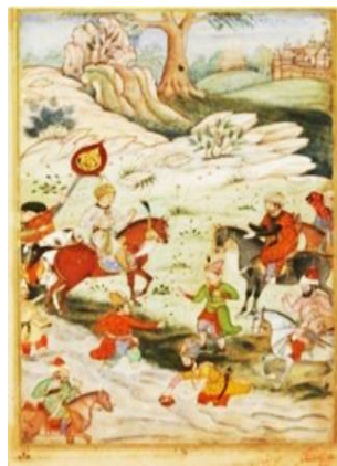
تصویر ۱- ملاقات بابرشاه با سلطان علی میرزا، بابرنامه، ۱۵۹۰م، موزه هنر متروپولیتن، نیویورک

http://www.metmuseum.org/art/collection/search/451958