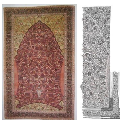
تصویر ۶- فرش محرابی هزارگل، شمال هند (کشمیر)، نیمهٔ دوم قرن هجدهم، هدایی جوزف مک‌مولان، موزهٔ متروپولیتن،