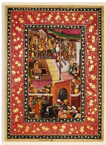
تصویر ۴- امپراتور جهانگیر در گردهمایی عید فطر. ۱۶۱۵-۱۶۲۵ میلادی، موزه برلین (URL 2)