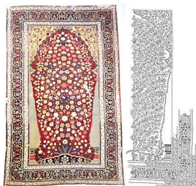
تصویر ۵- فرش محرابی هزارگل، شمال هند (کشمیر)، نیمهٔ اول قرن هجدهم، موزهٔ هنر و صنعت وین (waker,1997: 131)

دو قالیچهٔ محرابی هزارگل منتسب به مغولان هند در موزهٔ هنرهای کاربردی اتریش واقع در وین (تصویر ۵) و در موزهٔ آرتور ساکлер دانشگاه هاروارد (تصویر ۶) نگهداری می‌شوند. علی‌رغم تبدیل شکوفه‌های زمینه به دسته گل‌های متنوع رشد کرده از یک ساقه یا پایه، قالیچهٔ محفوظ در موزهٔ وین، درجه‌ای از طبیعت‌گرایی با نظام شاخه‌های واضح در خود دارد. درختان سرو قرارگرفته در زمینه نیز طبیعت‌گرایانه هستند. گیاهان گل‌دار بر یک برآمدگی کنگره‌دار رشد یافته‌اند که روی آن‌ها ردیفی از گل‌ها نمایش داده شده است. اما قالیچهٔ هاروارد، ترکیبی است از ساقه‌های منتظم گل‌دار که از گلدانی کم‌عمق و پایه‌دار برآمده‌اند. طرح‌وارگی و نبود تأثیرات طبیعت‌گرایانه به‌وضوح در آن مشهود است. همچنین تقارن و انتظام در جای‌گیری نقوش تزئینی آشکار است. تاریخ نیمهٔ اول قرن هجدهم میلادی به قالی وین و اواسط همان قرن به فرش محفوظ در موزهٔ هاروارد منتسب شده است.