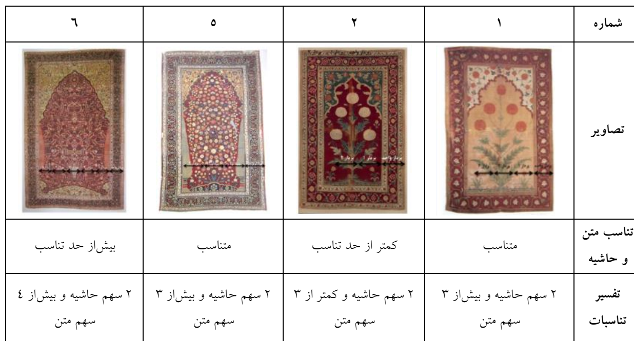
جدول ۳- چگونگی تناسب میان متن و حاشیه قالی‌های محرابی هندی مغول

سهم از عرض قالی به حاشیه‌ها تعلق یافته است (تصویر ۶). در قالی‌های محرابی چندگانه (صف‌ها)، این تناسب قابل‌بررسی نبود؛ زیرا عرض قالی به‌واسطه تکرار محراب‌ها، در قیاس با دیگر نمونه‌ها، از حالت استاندارد خارج شده است. در نمونه سوم که به قالی آینارد مشهور است نیز این مؤلفه به‌دلیل نبود عرض حاشیه در قسمت طول قالی، قابل‌بررسی نبود. به‌منظور سهولت در تحلیل حالات یادشده، جدول ۳ ارائه شده است. باتوجه‌به در دسترس نبودن ابعاد نمونه‌ها، با ملاک قرار دادن بردار واحد مبتنی بر عرض حاشیه طولی در هر فرش، تناسب تقریبی آورده شده است.