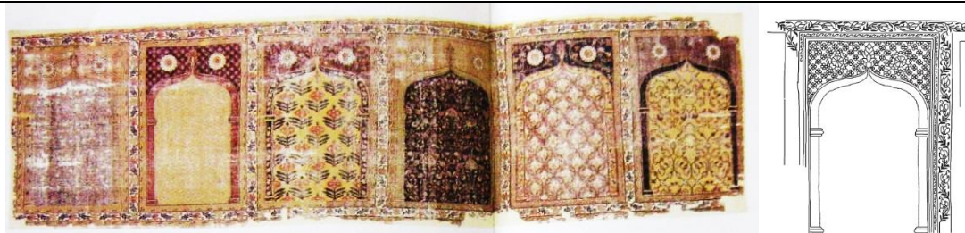
تصویر ۸- فرش چندمحرابی (صف)، دکن، قرن هجدهم، مجموعه مارشال و مرلین ولف (Walker, 1997: 136-137)

احتمال اینکه قالی‌های محرابی صف از دکن، جزء سجاده‌ها با کاربرد مذهبی به‌شمار آیند، زیاد است. حداقل در یکی از قطعات دکنی، فرسودگی قابل توجه در پایین‌ترین بخش محراب‌ها، جایی که نمازگزار زانو می‌زند، نمایان است. کوهن معتقد است احتمالاً اغلب مساجد در دکن می‌بایست با صف‌ها پوشیده می‌شدند و این براساس گونه‌های پنبه‌ای تخت‌بافت برجای مانده‌ای است که به‌صورت محلی تهیه شده‌اند (Cohen, 1986: 126-127). پس منطقی است که گونه‌های پُرزدار از این طرح نیز بافته شده باشد.