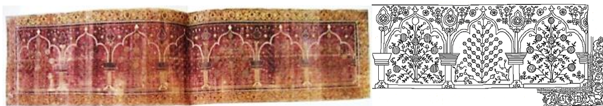
تصویر ۷- فرش چندمحرابی (صف)، دکن، قرن هجدهم، مجموعه خصوصی (Walker, 1997: 134-135)

در گروه نخست از قالی‌های صف هندی، رنگ قرمز تیره در زمینه قوس‌ها و لچک‌ها و رنگ زرد در حاشیه اصلی، عمومیت دارد (تصویر ۷). این صف‌ها مشتمل بر ردیفی ممتد از قوس‌های قرار یافته بر ستون‌هایی با سرستون‌های جام‌مانند هستند. بهره‌گیری از نقوش گیاهی همچون درخت انار، در میانه قوس‌های کنگره‌دار عمیق به طور متناوب نمایان است. رأس قوس‌ها نیز با نیلوفرهای آبی کوچک تزیین شده است. در لچکی‌های بالای هر ستون، یک قسمت محافظ‌مانند قرار گرفته که به گل‌دسته‌ها یا عَلم‌های مراسم آیینی شبیه است (Walker, 1997: 133). اما محتمل‌ترین پیشینه آن، نیلوفرهای آبی یا شاه‌عباسی هستند که نقشی مشابه در قالی‌های هندو-ایرانی است. اغلب طراحی شاخه‌های ختایی در قسمت حاشیه زاویه‌دار هستند. حاشیه‌های باریک شاخه‌های ختایی و بخش‌های قلبی‌شکل در ساختار مداخل دارند. شایع‌ترین نقش تزیینی از حاشیه باریک این تولیدات، ساختار نقش قلاب (S-Border) است. منابع این نقش حاشیه را عموماً تکرار متوالی حروف S و Z دانسته‌اند (بصام، ۱۳۹۲: ۲۶۱).