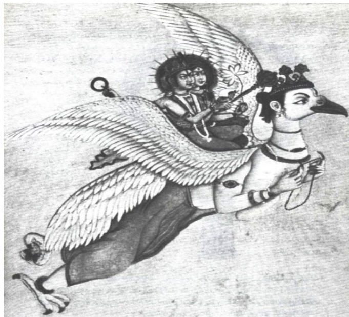
تصویر ۲: گارودا، شهریار پرندگان و مرکب ویشنو و لکشمی (ایونس، ۱۳۸۱: ۱۷۹).

افروز شیوا قرار گرفته و تمثیلی از نیروی تولد، تناسل و آفرینش است (شایگان، ۱۳۸۶: ۲۵۶) و شیوا آن را در حمایت از سوما بر تارک خویش نشانده است. (تصویر ۱) بدین ترتیب سوما که قبلاً با ویژگی‌های برجسته‌ی زیادی از جمله حیات بخشی و جاودانگی شناخته شده بود، به موقعیت تازه‌ای در میان خدایان مقتدر هند دست پیدا می‌کند. پیوستگی وجود سوما با سرنوشت خدایان، در اساطیر هند جلوه‌های دیگری نیز دارد که از آن جمله می‌توان به ماجرای گارودا (Garuda)، شهریار پرندگان و مرکب ویشنو (Vishnu) ایزد محافظ کاینات، اشاره کرد. وی که از احترام بسیاری در نزد هندوان برخوردار بود، از موجوداتی است که مشمول این موهبت شده و به واسطه‌ی وجود سوما، به جاودانگی دست یافت. گارودا پرنده‌ای بود با سر، بال، چنگال و منقار عقاب که دارای تن و اندام‌های انسانی بود. وی با نفرت بسیار از اهریمنان و بدی زاده شد. در ماجرای ویناته (Vinata)، مادر گارودا، به دست مارها و در سرزمین‌های زیرین زندانی می‌شود. مارها برای خلاصی ویناته، ماه را از گارودا به رشوه می‌خواهند. گارودا پس از تحمل مشقت‌های بسیار خود را به ماه رسانده، آن را ربوده و در زیر بال خود نهان می‌سازد و پس از این کار عازم سرزمین‌های زیرین می‌شود.